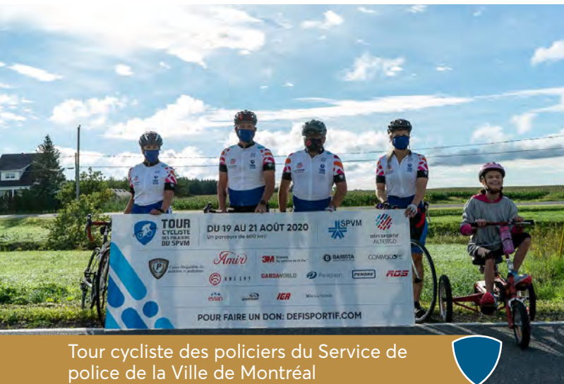
Tour cycliste des policiers du Service de police de la Ville de Montréal

afin de contribuer à leur survie, et à donner notre appui à l'engagement de nos membres qui ont apporté une aide directe aux citoyens. C'est d'ailleurs avec empressement que nous avons accepté de participer à la collecte de fonds de la Sûreté du Québec au profit des Banques alimentaires du Québec en versant une somme de 5 000 $ tirée de notre Fonds d'aide au développement du milieu.