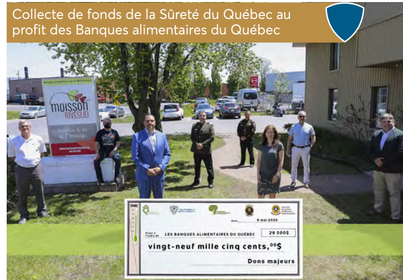
Collecte de fonds de la Sûreté du Québec au profit des Banques alimentaires du Québec