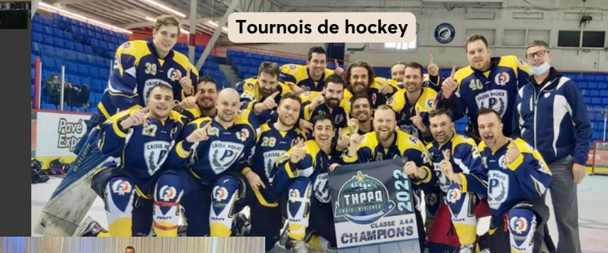
Tournois de hockey