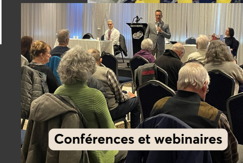
Conférences et webinaires