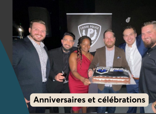
Anniversaires et célébrations