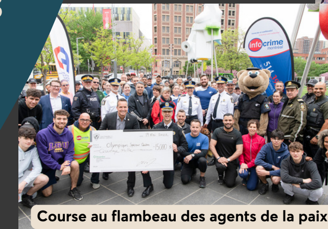
Course au flambeau des agents de la paix