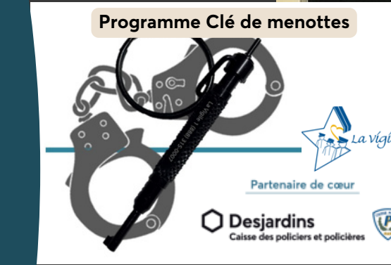
Programme Clé de menottes