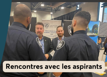
Rencontres avec les aspirants