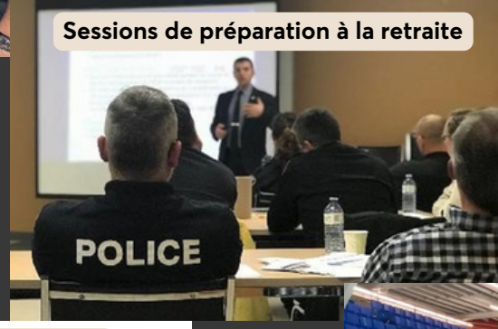
Sessions de préparation à la retraite