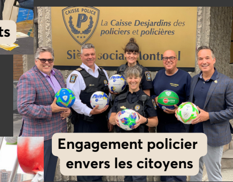
Engagement policier envers les citoyens